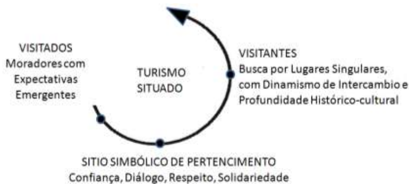
Figura 1 - O turismo situado como conector na realidade dinâmica do sítio turístico

O turismo situado no Morro da Conceição se apresenta como possibilidade de desenvolvimento de ações socioeconômicas e culturais convergentes com a matriz simbólica conformada ao longo da trajetória histórica local, como será visto no próximo tópico. Nesse sentido, conecta de maneira fecunda e virtuosa os seguintes componentes da realidade dinâmica do sítio turístico: as expectativas emergentes dos moradores visitados, os sentidos simbólicos de pertencimento que emanam do lugar e o interesse dos visitantes por lugares singulares, com dinamismo de intercâmbio e profundidade histórico-cultural (Figura 1).