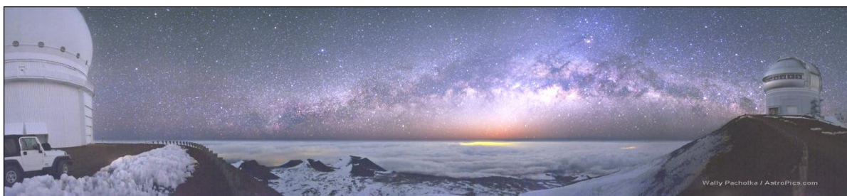
Figura 2. Mauna Kea Milky Way Panorama 4

Da mesma forma, observatórios contemporâneos que disponibilizam visitas públicas também constituem atrativos turísticos, atraindo milhares de visitantes pelo mundo, que geralmente tem a oportunidade peculiar de realizar observações astronômicas in loco , como por exemplo, Mauna Kea Observatories (Figura 2), no Havaí, e no Brasil, o Observatório Abrahão de Moraes (OAM), entre tantos outros.