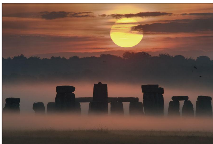
Figura 1. Amanhecer do solstício em Stonehenge 3

De acordo com Linhares (2011), os mais antigos observatórios astronômicos foram os pré-históricos – conhecidos como observatórios arqueoastronômicos –, a exemplo de Stonehenge (Figura 1), na Inglaterra, Machu Pichu e Cusco , no Peru, entre outros, com características distintas dos equipamentos contemporâneos, pois utilizavam instrumentos bastante precários.