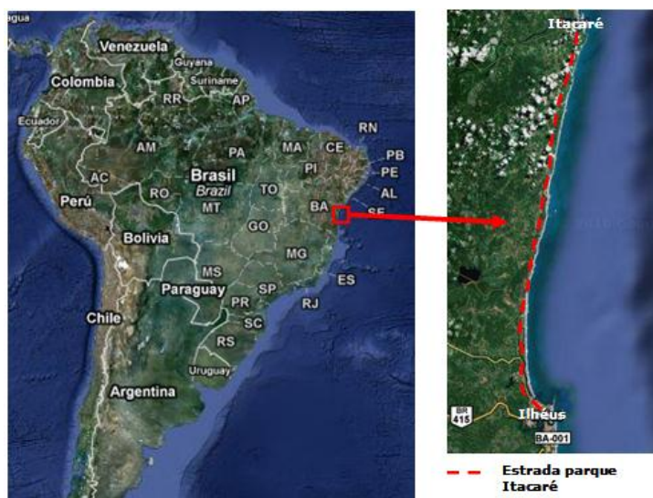
Figura 2. Localização da Estrada-parque Itacaré