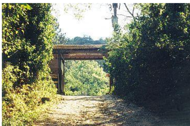
Figura 6. Portal de entrada do parque