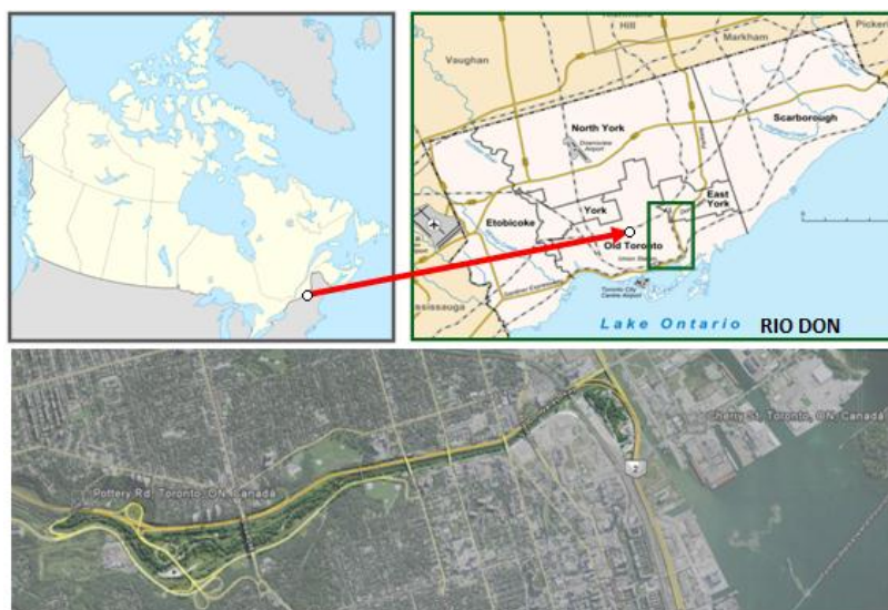
Figura 10. Localização da Estrada-parque do Vale do Rio Don

localizada junto a antigas instalações industriais fez com que a forma do traçado, principalmente para transeuntes, fosse criada a partir dos edifícios existentes dentro da sua área urbanizada, e em conformidade com as vias adjacentes, ferrovias e percurso do Rio Don. Passarelas permitem que os pedestres atravessem a rodovia com segurança (Bonnell, & Fortin, 2010).