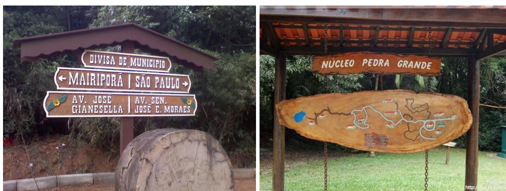
Figura 7. A linguagem “rústica” utilizada nas placas de identificação dos locais é bastante condizente com a linguagem arquitetônica

Cabe agora, para encaminhamentos de resultados desta pesquisa, comparar a propaganda turística feita por meios digitais da internet de estradas-parque do exterior com os casos brasileiros. Para tanto, serão levantadas aqui a Romantische Straße (Estrada Romântica) na Alemanha e a estrada-parque no Vale do Rio Don no Canadá dentre outras que foram analisadas nesta pesquisa. Vale notar que a quantidade da informação, bem como a qualidade de material iconográfico coletado para análise nos casos estrangeiros é muito mais significativa que dos casos brasileiros.