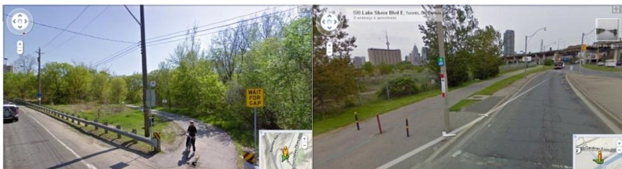
Figura 11. Acesso pela Pottery St. (à esquerda) e pela Cherry St. (à direita) à via Parque no Vale do Rio Don