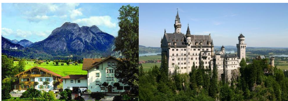
Figura 9. Vista de Schwangau (à esquerda) e do Castelo de Neuschwanstein (à direita) ao longo da Estrada Romântica