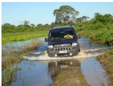
Figura 1. Parte da Estrada-parque do Pantanal inundada em épocas de cheia

A estrada compreende as rodovias estaduais MS-184 e MS-228, sendo considerada uma unidade de conservação pelo governo de Mato Grosso do Sul em 1993. O traçado remonta às rotas originais das grandes boiadas e caminhos naturais do Pantanal. Foi traçada originalmente por Marechal Cândido Rondon ao trazer a rede de telégrafos para a região. Sua construção só foi possível com aterros que variam de um a três metros que procuram garantir o deslocamento em qualquer época do ano; porém essa condição é comprometida nas cheias mais intensas (Estrada Parque Pantanal, 2010). Mas a própria cheia acaba por se tornar também uma forma de atração, segundo muitas imagens de divulgação turística (Figura 1).