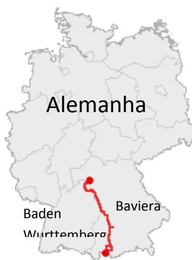
Figura 8. Localização da Estrada Romântica

sentidos da estrada (Estrada Romântica da Alemanha, 2010).