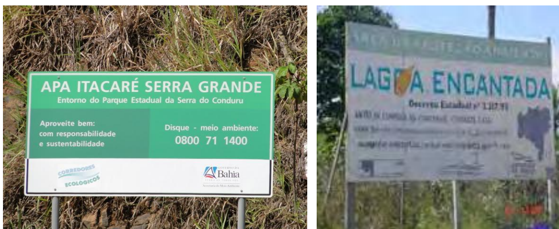
Figura 3. Placas com padrões diferentes de comunicação visual

associadas a remanescentes bem preservados da Mata Atlântica (Pontos Turísticos da Região, 2010). Com áreas de preservação ambiental, a fauna se apresenta muito rica na região, principalmente com a presença de aves, tornando-se também um atrativo para a fruição do turista (Figura 4).