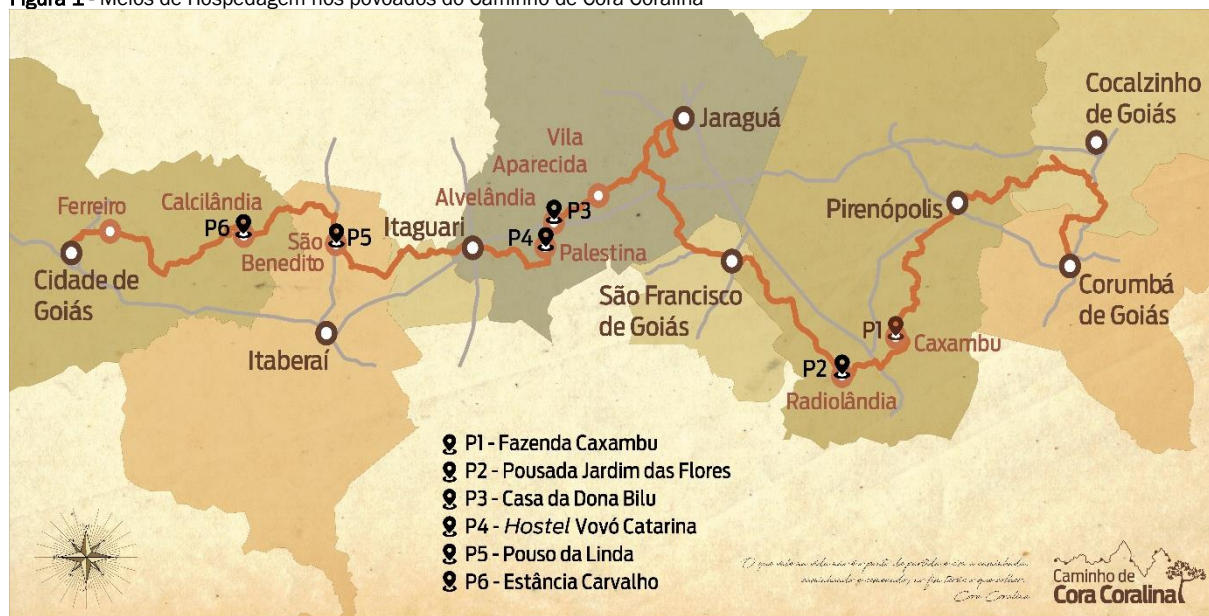
Figura 1 - Meios de Hospedagem nos povoados do Caminho de Cora Coralina