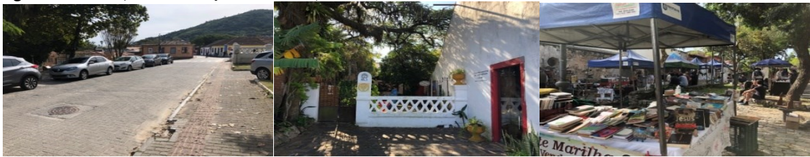
Figura 3 - Visuais a partir das estações A, B e C respectivamente