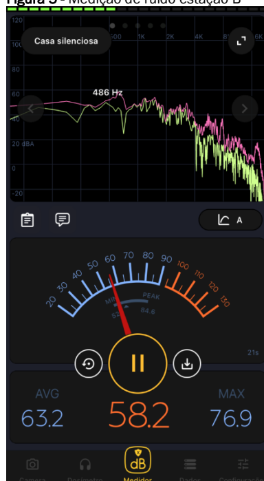
Figura 5 - Medição de ruído estação B