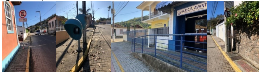
Figura 1 - Situações de acessibilidade em Santo Antônio de Lisboa