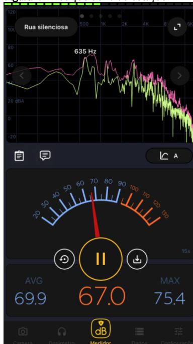
Figura 4 - Medição de ruído estação A