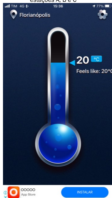
Figura 7 - Medição da temperatura nas estações A, B e C