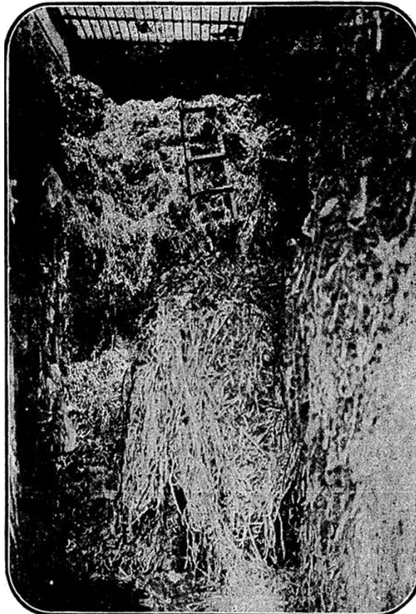
Figura 3 - Serpentina abarrotada até o teto da loja da Rua Misericórdia, n. 80