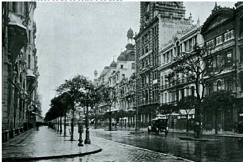
Figura 1 – Foto da Avenida Rio Branco na cidade do Rio de Janeiro. A foto foi tirada às 16h do sábado de 26 de outubro de 1918