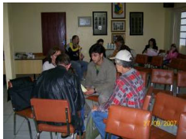
Figuras 1 e 2: Oficina de planejamento participativo e trabalho em equipe.