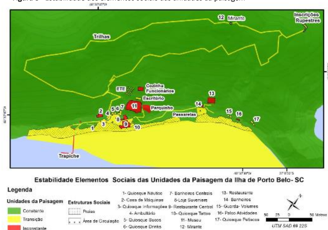
Figura 3 - Estabilidade dos elementos sociais das unidades da paisagem