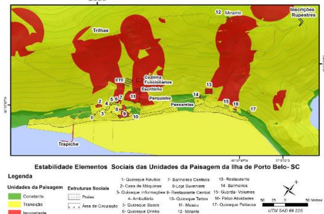
Figura 4 - Estabilidade das unidades da paisagem da área de acesso da Ilha de Porto Belo-SC